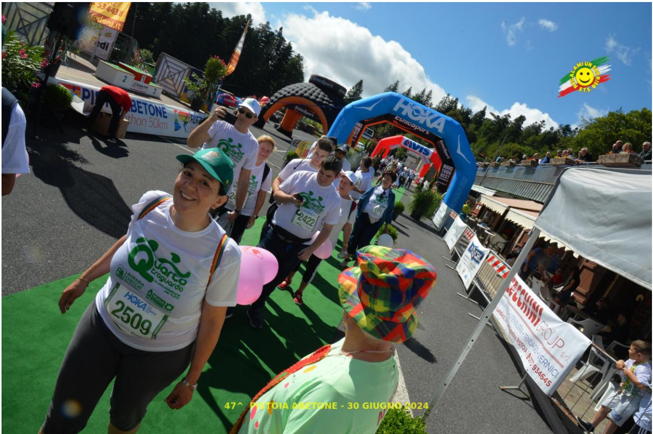
47^ PISTOIA ABETONE - 30 GIUGNO 2024