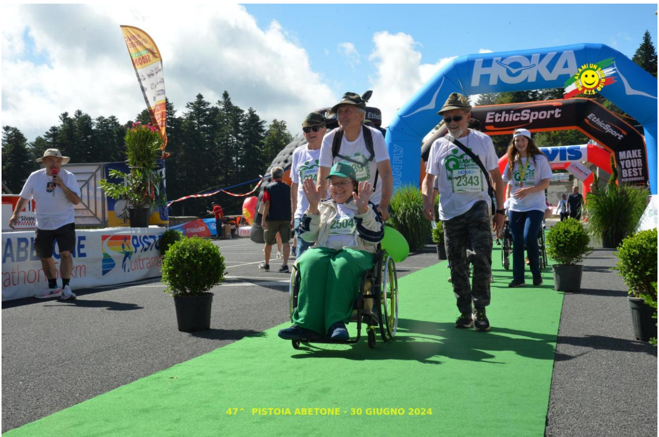
47^ PISTOIA ABETONE - 30 GIUGNO 2024